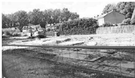
Slooplocatie aan de Rembrandtstraat

Laat ons uw ervaring weten. Komt u langs tijdens ons inloopmoment of stuur een mailtje naar info@amiepedia.nl