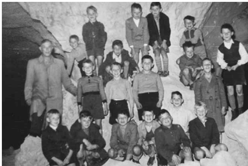
Schoolreisje naar de 'grotten' in de Sint Pietersberg in 1958

Amiepedia: van, voor en door de mensen van Amby ■